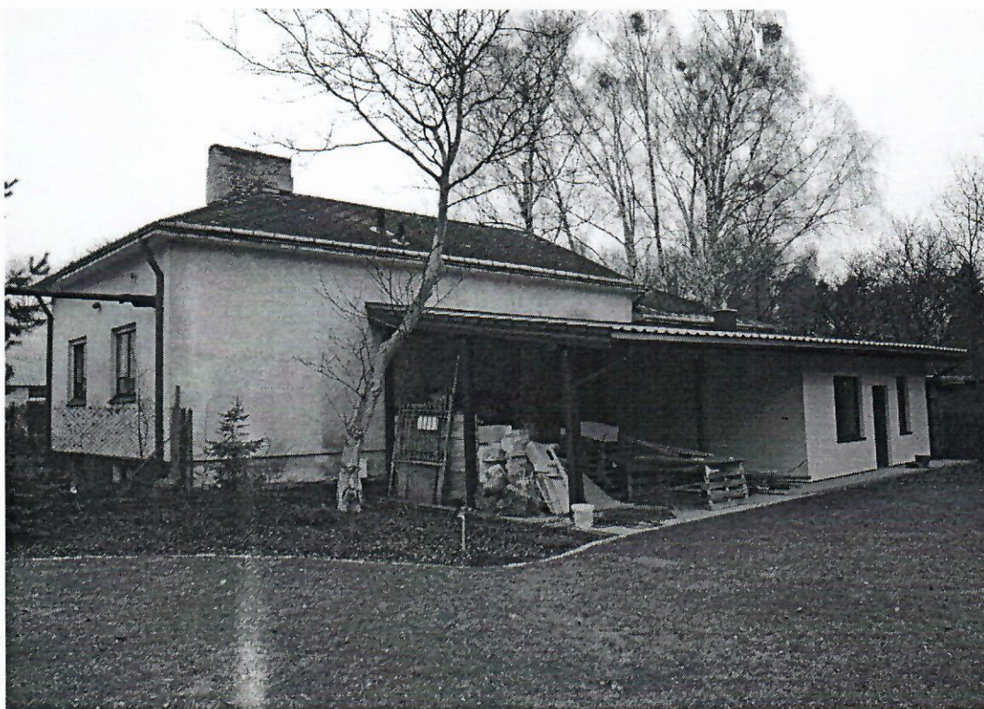
Fotografia 11 – Sąsiedni budynek usytuowany w ostrej granicy działki

Jako zabezpieczenie istniejącego sąsiedniego budynku gospodarczego usytuowanego w ostrej granicy działki, na której znajdują się budynki przeznaczone do rozbiórki, proponuje się pozostawienie podłużnej ściany piwnicy budynku gospodarczego nr 1 wraz z jej fundamentem na całej długości budynku. Zaleca się również pozostawienie fragmentów ścian prostopadłych usztywniających ścianę podłużną. Po rozebraniu budynku wraz ze stropem nad piwnicą, należy zasypać podłużną ścianę jak i całą przestrzeń piwnicy gruntami niespoistymi zagęszczonymi do wskaźnika zagęszczenia I_s \geq 0.98 , które będą tworzyły gruntową przyporę dla pozostawionej ściany budynku gospodarczego nr 1.