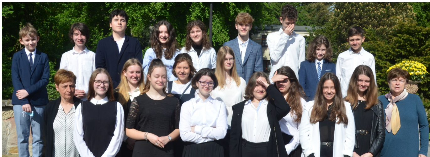
Ubiegłoroczna klasa 8a