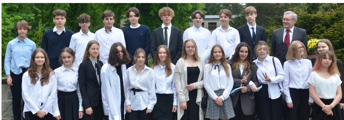
Ubiegłoroczna klasa 8b